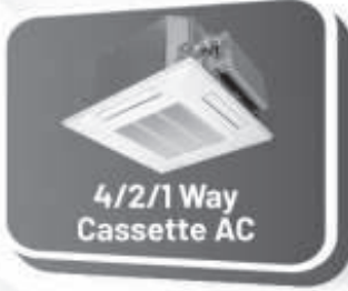
4/2/1 Way Cassette AC