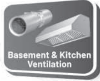
Basement & Kitchen Ventilation