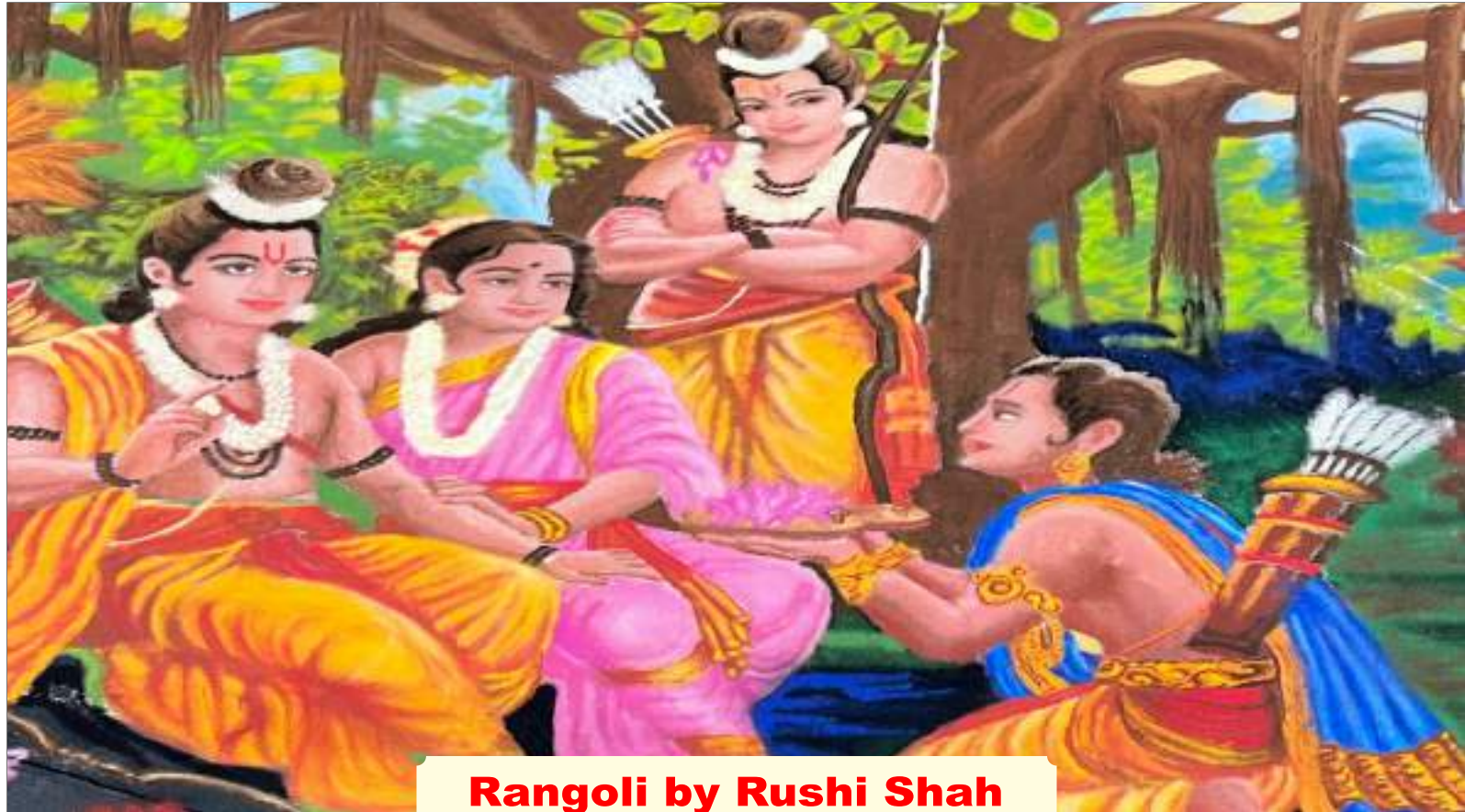
Rangoli by Rushi Shah